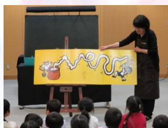
大型絵本 『もちつきくん』