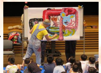
さらにこうなって