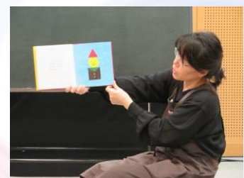
絵本 『さんかくサンタ』