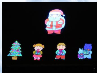
ブラックパネルシアター 『サンタが町にやってくる』