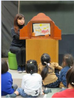
紙芝居 『つきよとめがね』