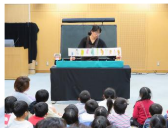
ペープサート 『十二支のお話』

クリスマスにお正月…この季節ならではのおはなしがいっぱい。聞きに来てくれたお友達もいっぱい！みんな楽しんでくれたかな？