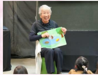
布絵本 『どんぐりころころ』