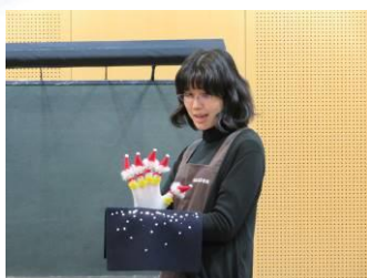
手袋人形 『サンタのこども』