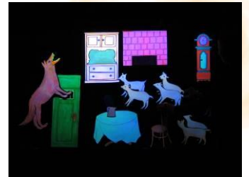
ブラックパネルシアター 『おおかみと七ひきのこやぎ』

おはなしボランティア「おはなしの森さんさん」のみなさんによるおはなし会を行いました。秋を感じてもらえるおはなしの数々に歌も！みんなで「どんぐりころころ」の歌もうたいましたよ♪