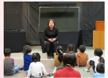
語り 『おいしいおかゆ』