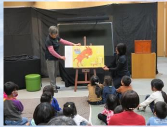
大型絵本 『どうぞのいす』