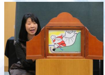
紙芝居 『よいしょよいしょ』